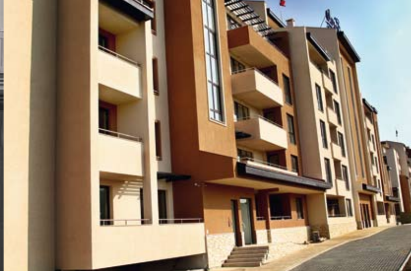
Einzigtige Lage in der ersten Reihe – 560 erstklassige Ferienwohnungen